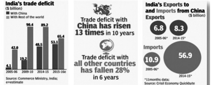
India's trade deficit, 2005-16 and India's exports to and imports from China, 2005-15; Graphic courtesy: The Times of India , April 22, 2016

దిగుమతి ఎగుమతుల మధ్య భేదాన్ని “వాణిజ్య లోటు” అంటారు. భారీ వాణిజ్య లోటు ఎదుర్కొంటున్న దేశం అంతర్జాతీయ మార్కెట్లో ఎక్స్పోజ్ అధికారాలను కోల్పోతుంది. భారత్ చైనావల్ల వాణిజ్య సవాలును ఎదుర్కొంటోంది. మితిమీరి ఉన్న ఈ అధిక వాణిజ్య లోటు భారత్ కు అత్యంత ఆందోళన కలిగించే విషయం.